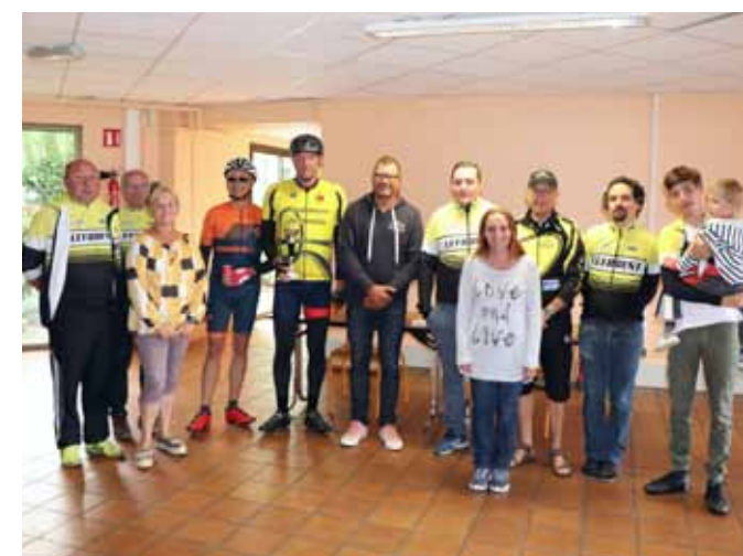
Dimanche 26 août Brevet cyclotouriste du Cyclo Club de Leforest