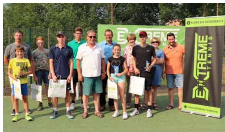
Samedi 7 juillet Finales du tournoi Binbin du Tennis Club de l'Offlarde