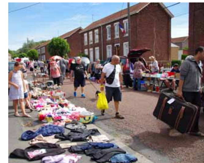
Dimanche 12 août Marché aux puces des Enfants du Bois