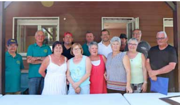
Dimanche 1er juillet Concours de pêche des Amis du Plan d'Eau