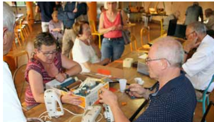
Mardi 3 juillet Repair Café avec Leforest Environnement