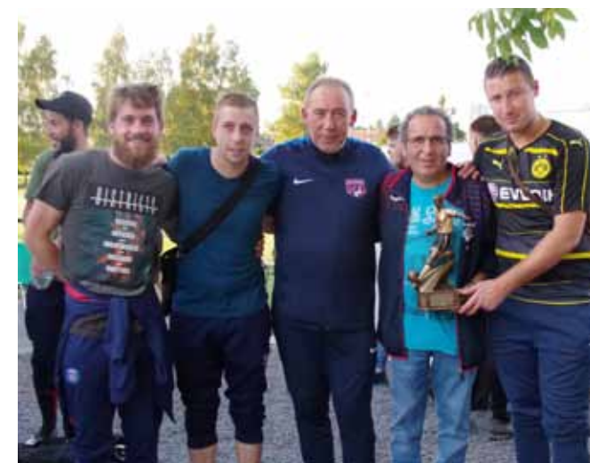
Samedi 18 et dimanche 19 août Tournoi Medhi Lecam de l'A.E. Football Leforest