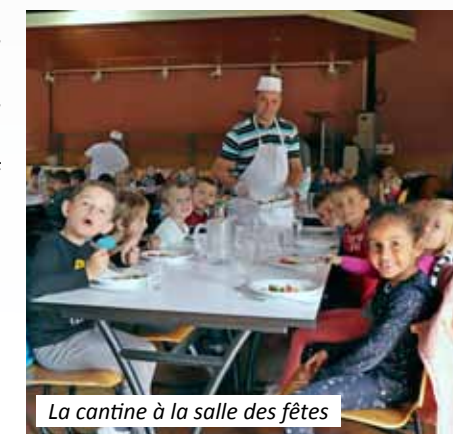
La cantine à la salle des fêtes

Budget 2017 : Dépenses : 337 648 € Prix de revient d'un repas : 8,14 € Recettes : 116 138 € Tarif repas pour les Leforestois : 3 € Coût pour la Ville : 221 510 € Tarif repas pour les extérieurs : 4 €