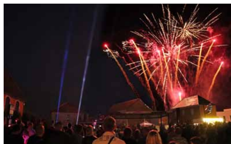
Samedi 13 juillet Feu d'artifice place Salengro