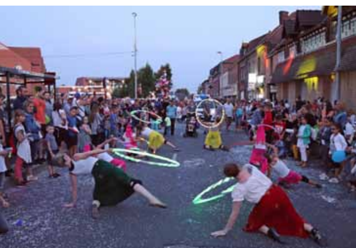
Samedi 13 juillet Défilé des associations locales dans les rues de la ville