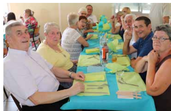
Samedi 7 et dimanche 8 juillet Week-end en fête du Comité des Fêtes du Planty