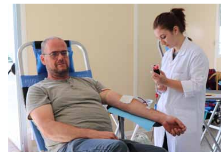
Vendredi 31 août Don de sang avec les Donneurs de Sang de Leforest