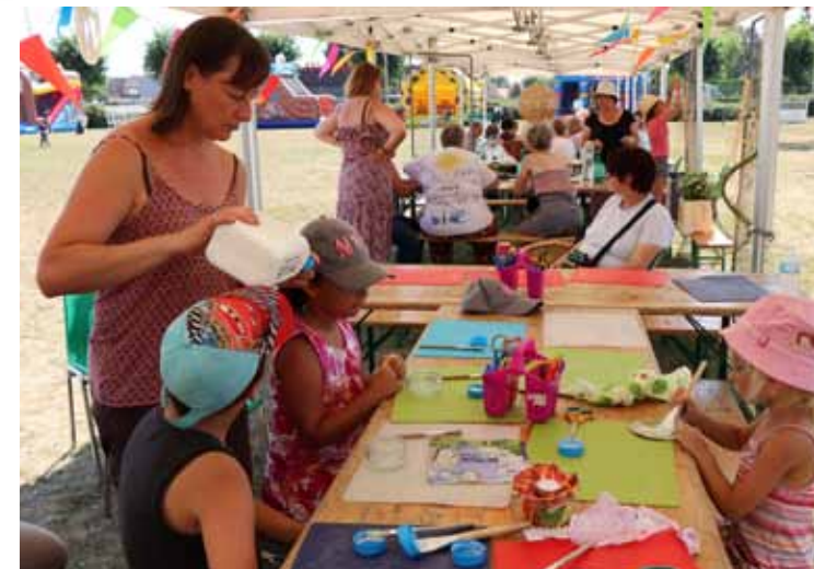
Du mercredi 1 er au vendredi 3 août Leforest Land Nos Quartiers d'Eté