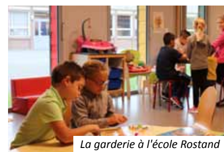
La garderie à l'école Rostand

De même, alors que la question se pose dans de nombreuses communes avec le retour de la semaine de 4 jours, force est de constater qu'à Leforest, le mercredi ne présente pas de problème depuis bien longtemps pour les parents qui travaillent ou qui sont empêchés. Un accueil à la journée leur est proposé et vient compléter l'offre de garde périscolaire.