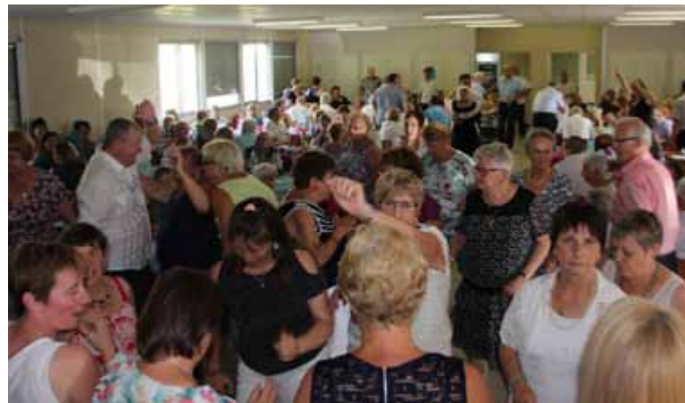
Samedi 8 et dimanche 9 juillet Week-end en fête du Comité des Fêtes du Planty