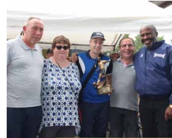
Samedi 12 et dimanche 13 août Tournoi "Medhi Lecam" de l'A.E. Football Leforest