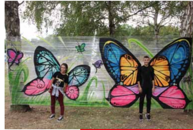
Du mercredi 2 au vendredi 4 août Nos Quartiers d'Eté Leforest-Land