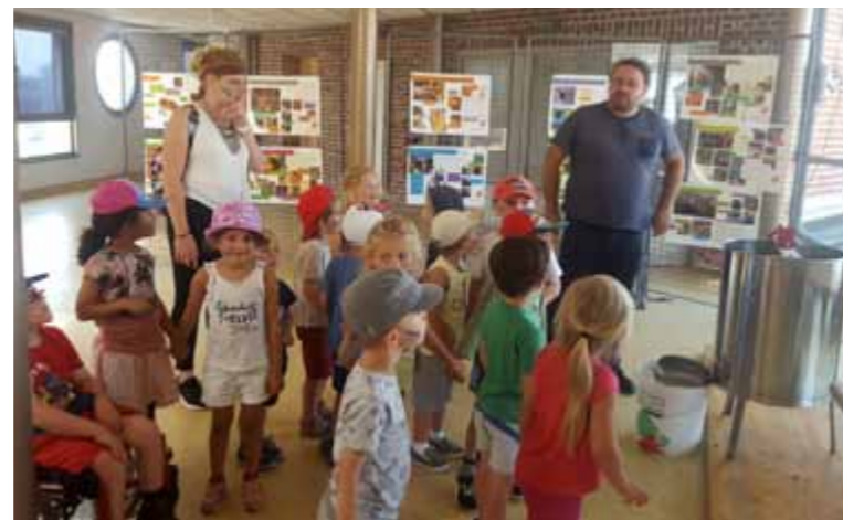
Mardi 18 juillet Récolte de miel avec les Centres de Loisirs et Leforest Environnement