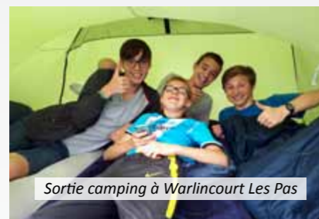
Sortie camping à Warlincourt Les Pas

Le succès rencontré par le Centre Ados conforte aujourd'hui la Municipalité à relancer le Pass' Sport dès le début du mois d'octobre. Chaque mercredi après-midi, les jeunes peuvent s'adonner à différents sports avec un encadrement assuré. L'inscription est de 10 € à l'année pour les Leforestois et 20 € pour les extérieurs.