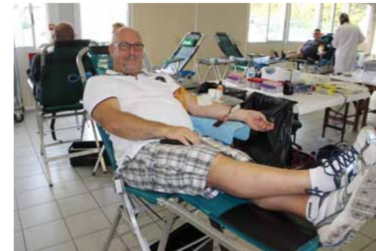
Dimanche 27 août Don de sang avec les Donneurs de Sang de Leforest