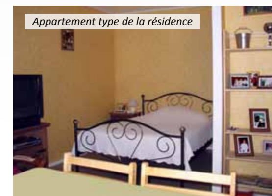
Appartement type de la résidence