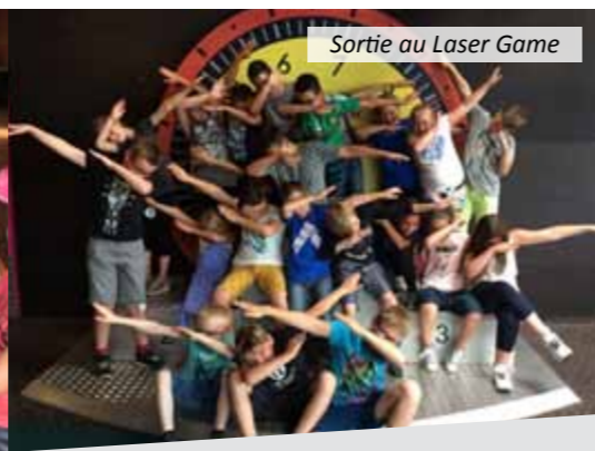
Sortie au Laser Game