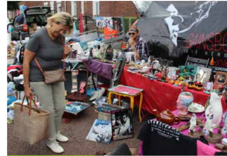
Dimanche 13 août Marché aux puces des Enfants du Bois