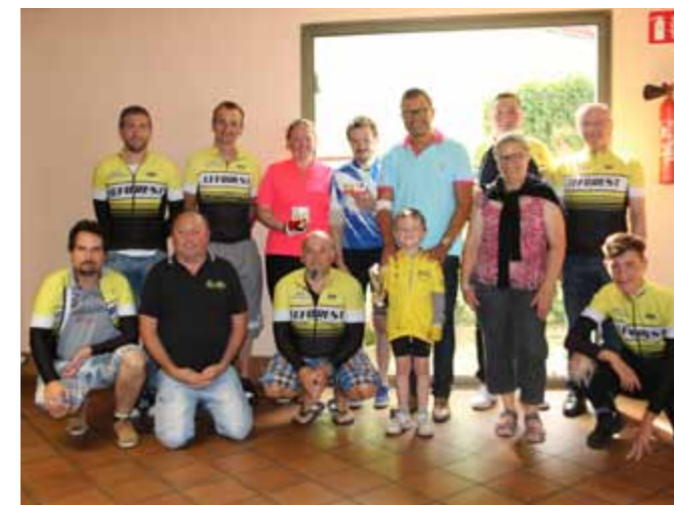
Dimanche 27 août Brevet Cyclo du Cyclo Club de Leforest