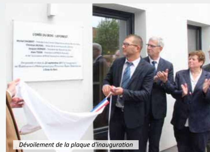
Dévoilement de la plaque d'inauguration

L'EHPAD L'Orée du Bois vient d'être inauguré en présence des acteurs et élus locaux.