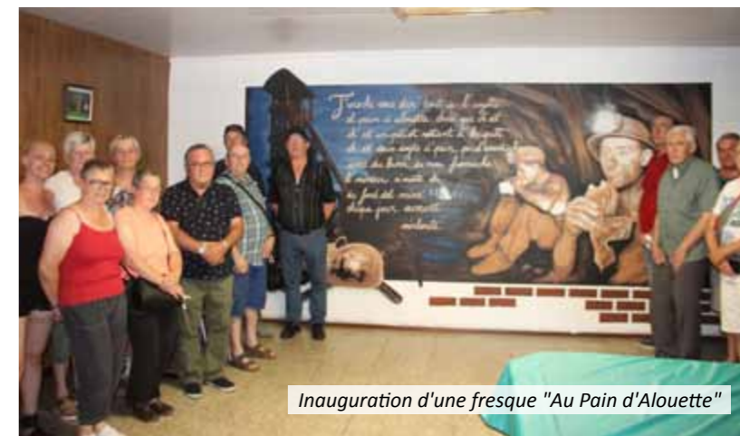
Inauguration d'une fresque "Au Pain d'Alouette"