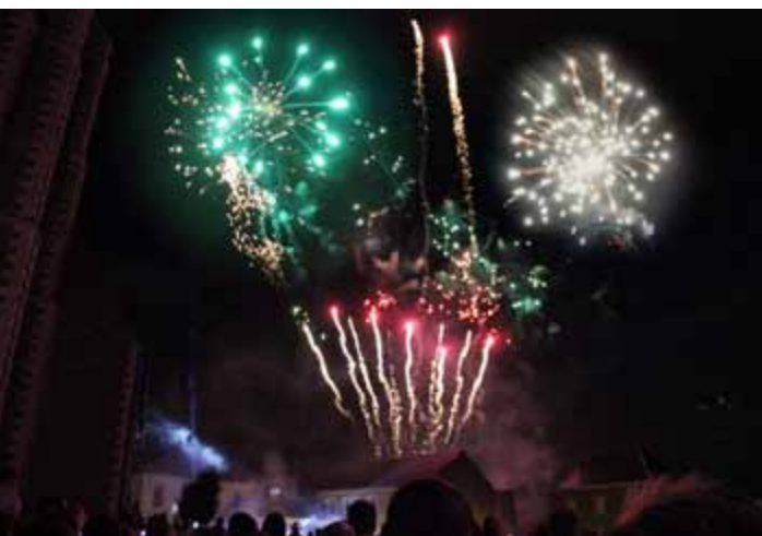
Jeudi 13 juillet Feu d'artifice Place Salengro