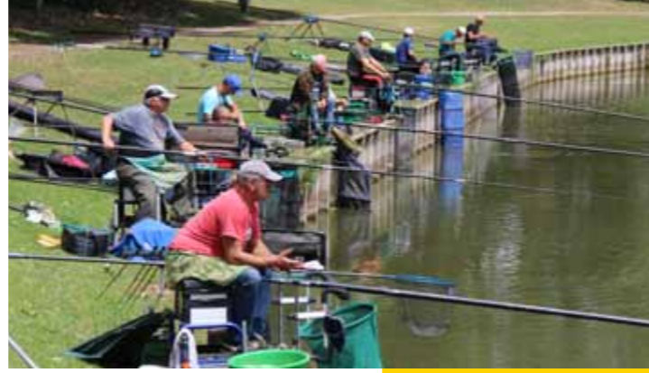
Dimanche 2 juillet Concours de pêche des Amis du Plan d'Eau