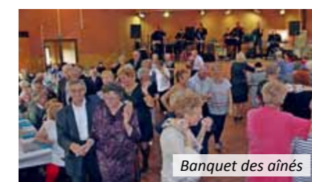
Banquet des aînés

Cette année, la Semaine Bleue se déroulera à Leforest du 15 au 22 octobre 2017. Elle débute en effet toujours par le traditionnel banquet des aînés, rendez-vous très attendu de nos séniors. D'ailleurs, si vous avez plus de 69 ans, vous pouvez y participer gratuitement seul(e) ou en couple,