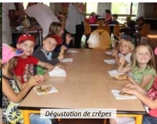
Dégustation de crêpes