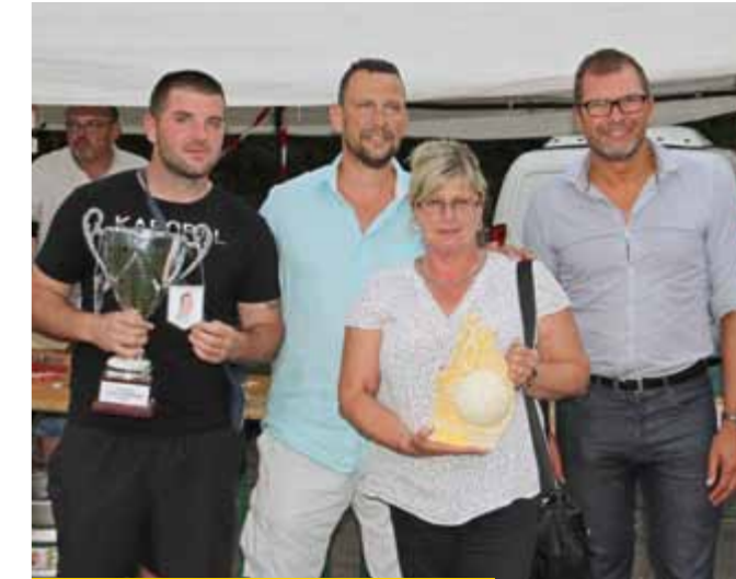
Samedi 26 août Tournoi "David Langrenez" du Football Club de Leforest