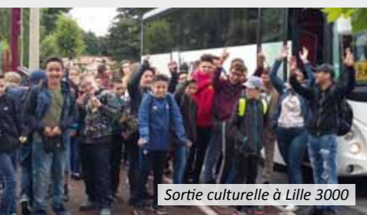
Sortie culturelle à Lille 3000

Le Centre de Loisirs "Concept Ados" dédié aux jeunes de 11 à 17 ans, a rencontré cet été, un grand succès. Des nouveaux horaires d'accueil, une équipe d'encadrement dynamique, un programme varié d'activités, il n'en fallait pas plus pour attirer nos ados, voire les fidéliser.