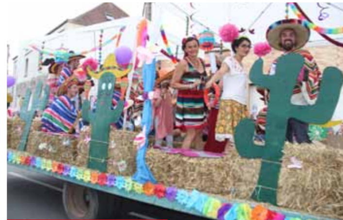
Jeudi 13 juillet Défilé de chars dans les rues de la ville