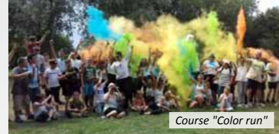
Course "Color run"

vacances d'hiver et de printemps, ont permis d'attirer d'autres jeunes. En fait, il fallait surtout que le Concept Ados ne fonctionne plus sur les mêmes bases que les Centres de Loisirs pour enfants de 3 à 11 ans, car un collégien ne veut plus être considéré comme un enfant et n'a pas non plus les mêmes attentes.