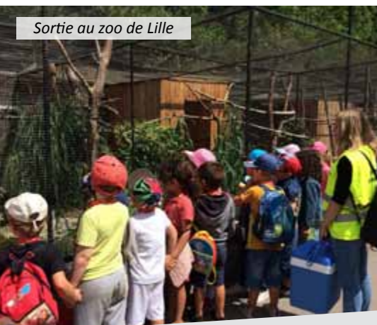
Sortie au zoo de Lille

Avec ses limites, l'équipe d'encadrement a néanmoins mis en place un programme varié qui a satisfait les petits comme les plus grands.